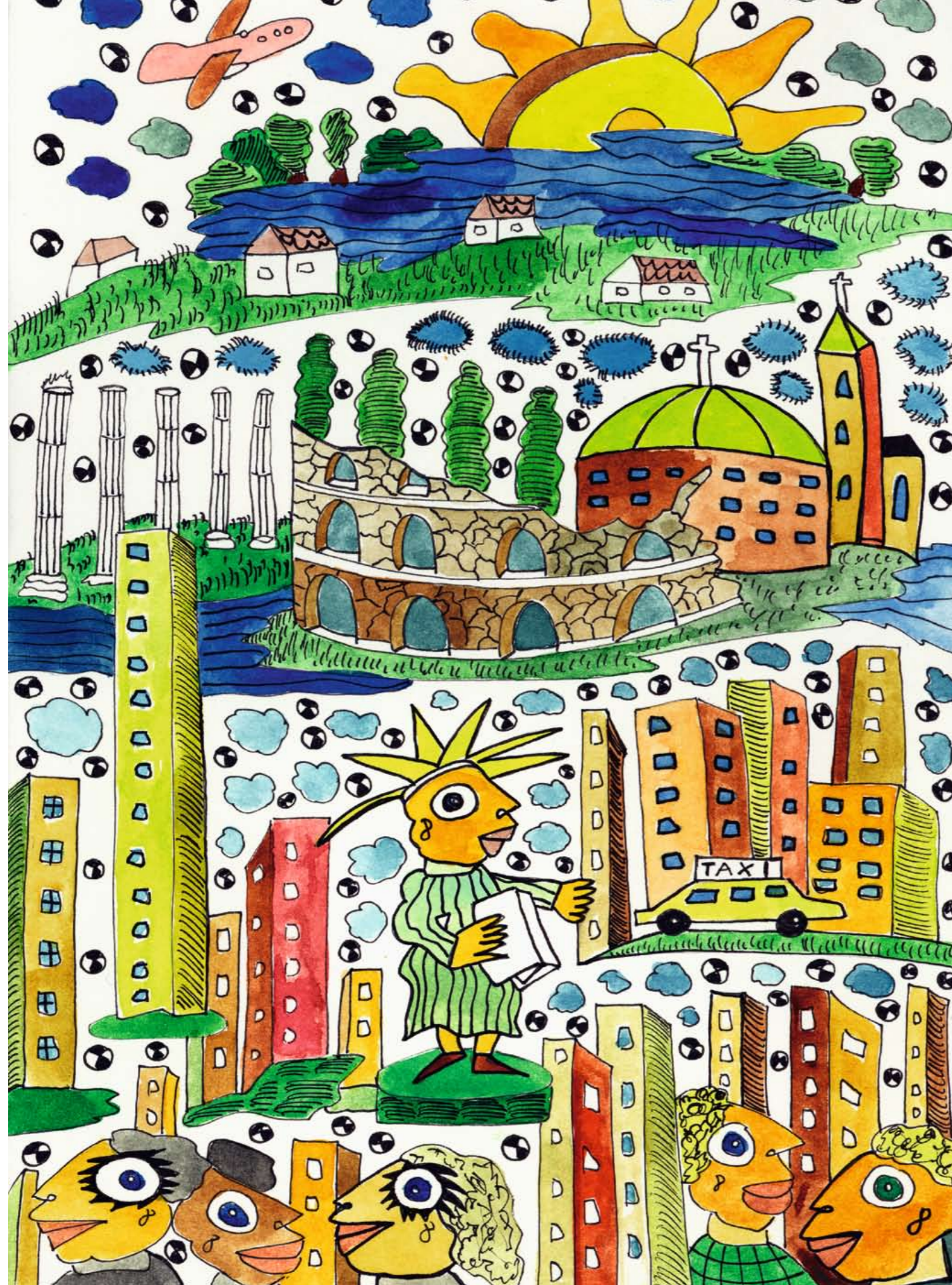
Illustration von Michael Fischer-Art